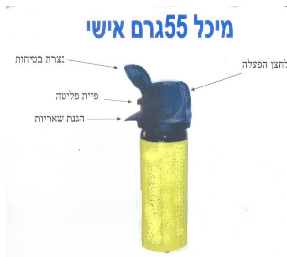
עמוד 112, מתוך 118 עמודים